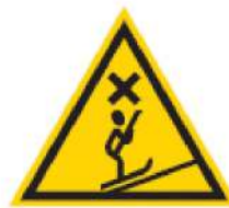
Пересечение с БКД